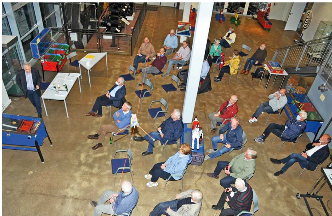
Mitgliederversammlung des Heimatvereins im Ausstellungsraum des Industriemuseums

Für das Registergericht erforderliche Satzungsänderungen wurden einstimmig angenommen. Die Versammlung schloss mit dem Appell, sich mit Zuversicht, Tatkraft und Improvisationstalent den aktuellen schwierigen Herausforderungen zu stellen.