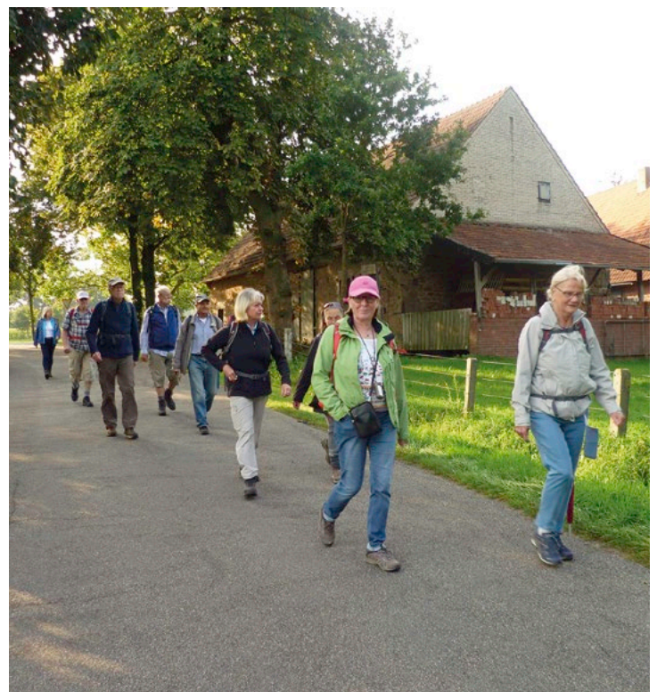
Auf dem sehr gut ausgezeichneten Rundweg M7 in Mettingen waren die Wanderinnen und Wanderer des VVO unterwegs.

Wer Interesse am Wandern hat, erhält nähere Informationen auf der Internetseite www.vvo-osnabrueck.de . Der monatliche Mitgliedsbeitrag beim VVO beträgt 1,50 Euro.