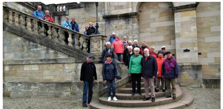
TVL-Gruppe vor Schloss Ebbenburg

sehr lange auf Reisen nach Augsburg und Rom in der Stadt. Ein Rundgang über die Außenanlagen der Veste stand ganz im Zeichen der Geschichte des Herzogtums Sachsen-Coburg. Eine Fahrt durch den Gottesgarten mit der Wallfahrtskirche Vierzehnhiligen und dem Kloster Banz erschloss der Gruppe eine schöne Landschaft im Obermaintal mit dem Abschluss in Seßlach, auch „Fränkisches Rothenburg“ genannt. Die Rückfahrt erfolgte durch das Heldburger Land, zu Zeiten der DDR ein abgeschottetes Gebiet im südlichen Thüringen. Auf 30 Kilometer wurde zweimal die Landesgrenze zwischen Bayern und Thüringen durchfahren. Vom Bayernturm bei Zimmerau ging der Blick weit in das Land, deshalb hieß der Turm auch Thüringenblick und war vor 30 Jahren Mittelpunkt der Grenzöffnung in dieser Region. Spezialitäten wie Coburger Bratwurst, Coburger Klöße und Coburger Schmätzchen sind nun in Löhne kein Geheimnis mehr und werden sehr geschätzt.